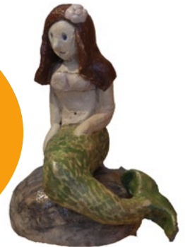
• Pinja Saarinen

En mä tiedä työpaja- ja päättötyö- näyttely 8.-26.4.2015