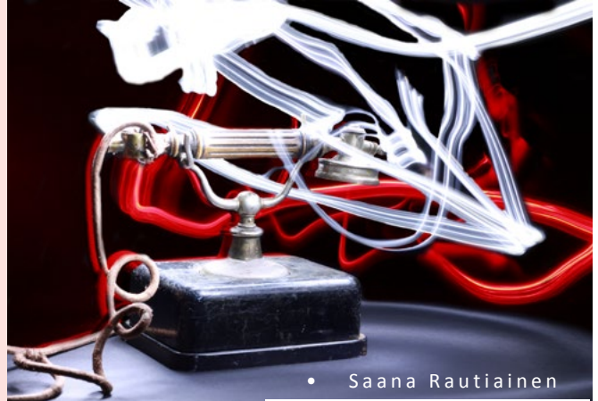
• Saana Rautiainen

En mä tiedä työpaja- ja päättötyö- näyttely 8.-26.4.2015